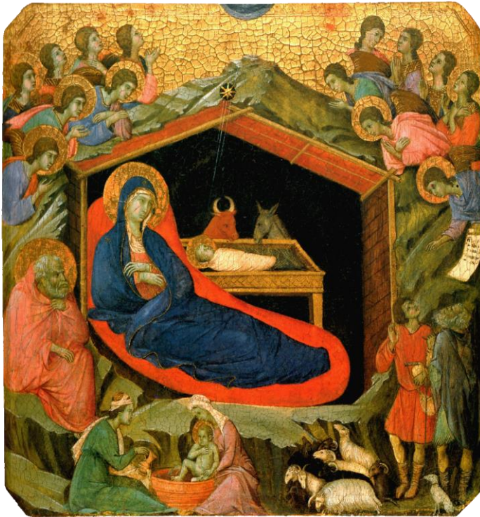
Duccio di Buoninsegna, Natività , dalla Maestà del Duomo di Siena, 1309-1311

Il Centro di Ricerca e Servizio DITALS è stato istituito nel 2005 allo scopo di realizzare tutte le attività previste per il rilascio della Certificazione di Competenza in Didattica dell'Italiano a Stranieri. A tale scopo il Centro svolge attività di ricerca e studio per la progettazione, l'elaborazione, la somministrazione e la valutazione delle prove previste dagli esami di Certificazione DITALS BASE, DITALS di I e di II livello, DITALS Base per la scuola, Il livello per la scuola e DITALS digitale. Oltre all'attività di certificazione, il Centro svolge anche attività di promozione e formazione nell'ambito dell'italiano come seconda lingua, integrata da una serie di servizi rivolti a studenti, docenti e amministratori che operano nel settore dell'italiano L2. Tra questi servizi rientrano sia la consulenza bibliografica nel settore sia il supporto scientifico e informativo per la realizzazione di corsi mirati alla preparazione agli esami DITALS.